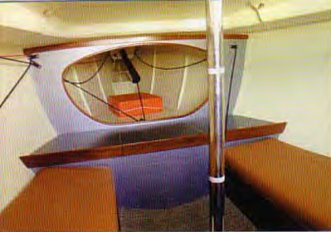
LES EMMÉNAGEMENTS SE RÉSUMENT À DEUX BANQUETTES ET TROIS COFFRES.

Plutôt que de pousser simplement le sac à l'intérieur, nous en profitons pour découvrir les emménagements. Le panneau gris monté sur vérin se relève facilement grâce à son poids plume. Il sera toutefois renforcé pour résister au poids d'un équipier. Attention de ne pas ouvrir ce panneau quand le barreur accoste ou effectue une approche car il gêne la visibilité sur l'avant. Une fois franchi le puits de quille, bien encombrant au milieu de la descente, on découvre un volume modeste dont la hauteur sous barrots se limite à 1,30 m. Pour le repos, deux longues